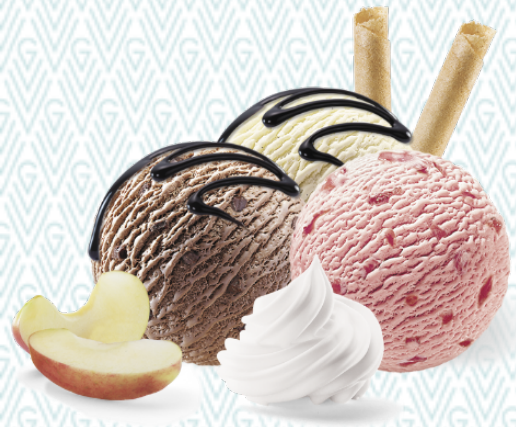
Coupe Rössli Erdbeer-, Chocolat- und Vanille-Rahmglace mit Schokosauce und Rahm CHF 10.50