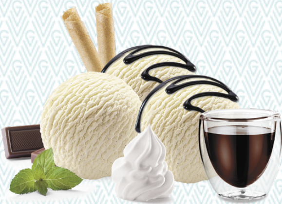
Coupe Dänemark Vanille-Rahmglace mit Schokoladensauce und Rahm CHF 10.50