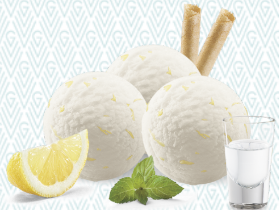
Sorbet Colonel Zitronen-Sorbet mit Wodka CHF 11.50