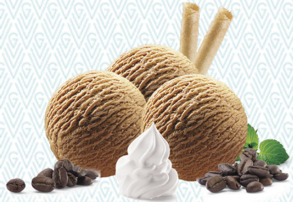
Ice Café Café-Rahmglace mit Rahm CHF 10.50