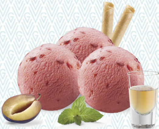
Sorbet Prune Zwetschgen-Sorbet mit Vieille Prune CHF 11.50