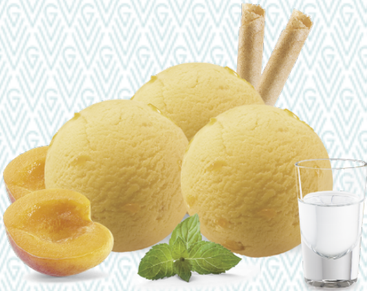
Sorbet Abricot Aprikosen-Sorbet mit Abricotine CHF 11.50